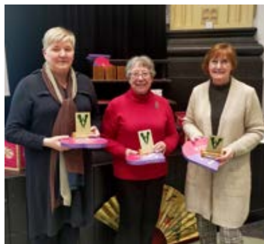
De winnende recreanten tonen hun door Christine Kal ontworpen trofee