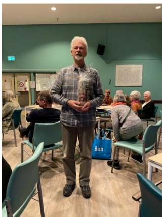
5 e Prijs i.v.m. het vijfjarig bestaan Niji

het meest gebezigde woord te zijn. Veel dank voor de vrijwilligers in de Oase, die mijn dankwoorden beantwoorden met 'met liefde gedaan', kijk zo kunnen we weer verder, er is liefde in het spel.