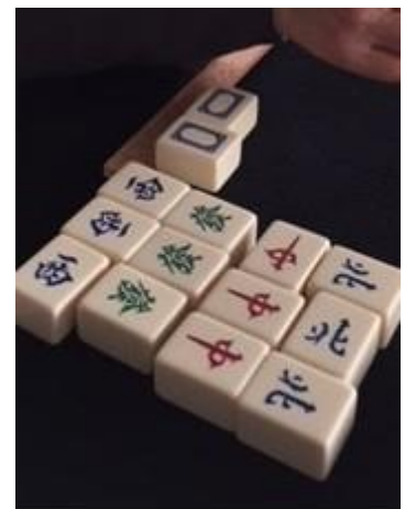
2e gemaakt op 9 maart 2018

In januari begint dit spel weer opnieuw en zoals je kunt zien is Ivanka Sonderman meteen fris en fantastisch begonnen.