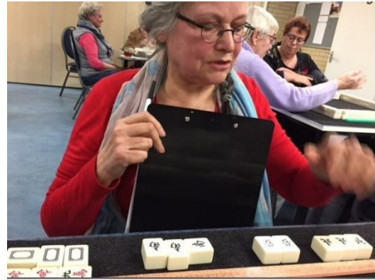
1e Mahjong van Ivanka gemaakt op 10 januari 2018

Deze worden genoteerd met datum, de samenstelling en de naam van de gelukkige, die dit heeft gemaakt en vervolgens in de wekelijkse stand van alle speeltafels opgenomen.